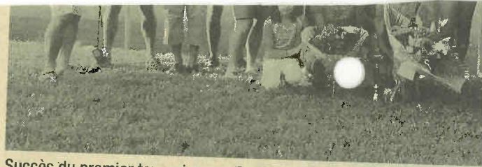
Succès du premier tournoi open.

Chez les dames, le duel serré opposant deux joueuses